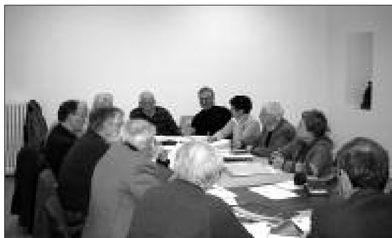
Les membres du conseil d'administration au travail dans les nouveaux locaux

C'en est fini du nomadisme pour la Société d'art et d'histoire de Sarlat et du Périgord Noir qui, samedi 13 février, a pris officiellement possession de ses nouveaux locaux dans la maison de La Boétie à Sarlat à l'occasion de son premier conseil d'administration de l'année 2010.