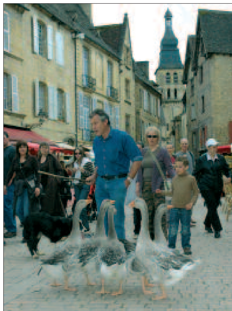
Des oies menées à la baguette !

Dimanche 21 février, Sarlat organise de nouveau la Fête de l'oie en Périgord. La ville et l'Office de tourisme mobilisent un grand nombre de partenaires pour contribuer à la réussite de cette manifestation.