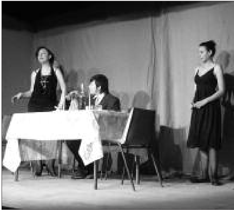
Les ados dans leur "improvisation" très réussie