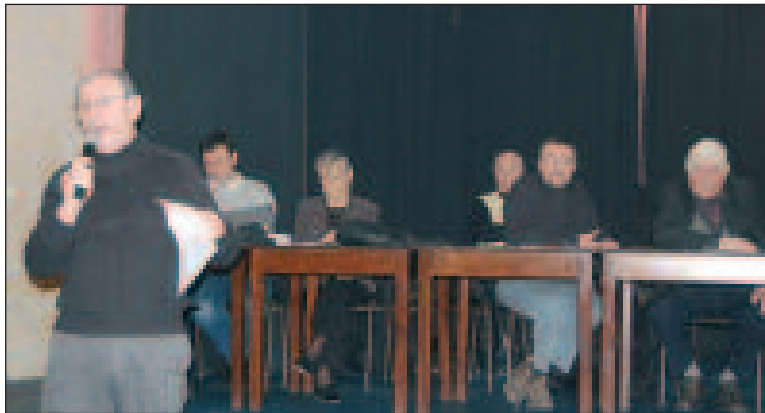
Les chiffres par le président Criner