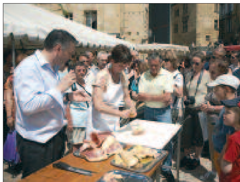
Démonstration de découpe d'un palmipède

Réservations et renseignements au 05 53 31 45 46 ou bien au 05 53 31 53 45.