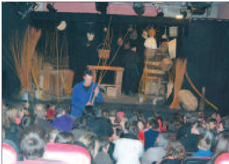
"Crocodéon en saule mineur"

Samedi 13 février au Centre culturel, le voile s'est levé sur le concours jeune-public "Loup y est-tu ?" du dernier Mois du Lébéro.