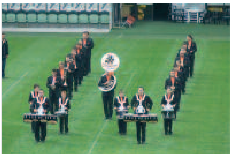
La formation de Saint-Brieuc

L'heure tourne, le temps passe vite... La Saint-Roch est à seulement quelques mois de l'échéance du week-end de l'Ascension (du 13 au 16 mai), où les musiciens briochins – ou de Saint-Brieuc car tout le monde ne fera pas le lien ! – viendront en Périgord Noir pour mêler leur musique à celle de son orchestre de rue.