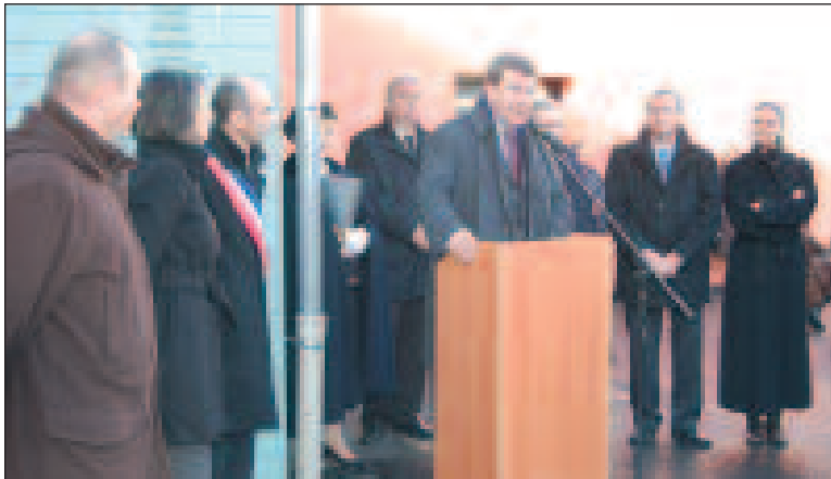
Le ministre entouré des personnalités