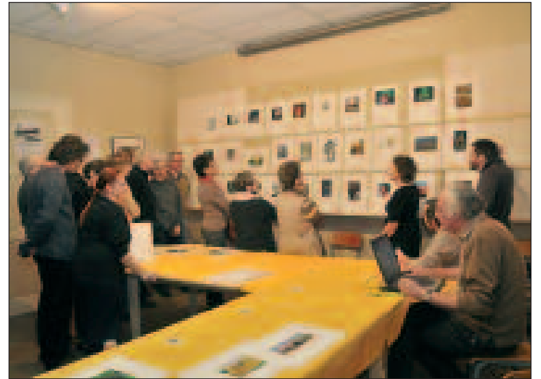
Séance de sélection des photos, un moment toujours intense !

A peine ont-ils eu le temps de savourer leur beau cadeau de fin d'année – une brillante deuxième place au Salon international de Tulle, partagée avec le club de Hongkong – que les photographes sarladais ont dû se remettre très vite au travail pour les sélections de la Coupe de France !