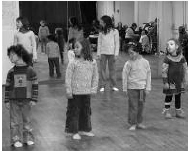
Atelier d'éveil corporel